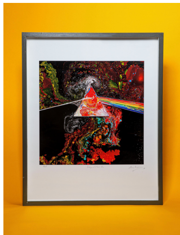
Liquid Dark Side of The Moon B2. Sérigraphie fine Art - Test - Signé Storm Thorgerson